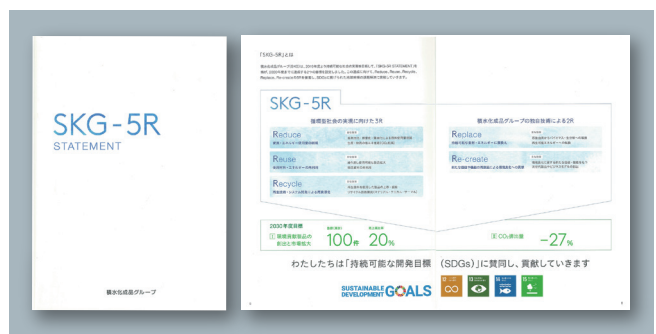
SKG-5R STATEMENT 冊子