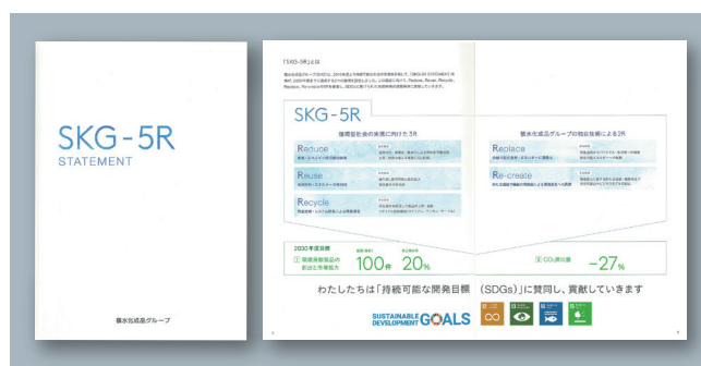
SKG-5R STATEMENT 冊子